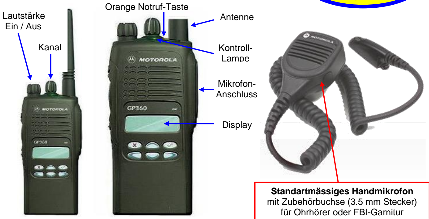
Standartmässiges Handmikrofon mit Zubehörbuchse (3.5 mm Stecker) für Ohrhörer oder FBI-Garnitur